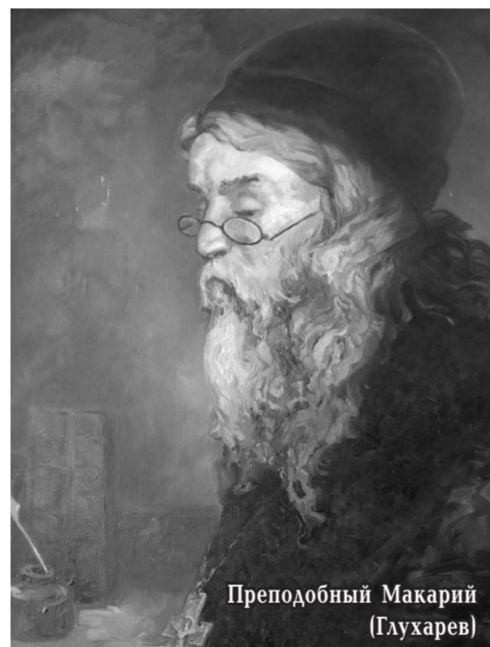
Преподобный Макарий (Глухарев)

Создателем алтайской письменности является основатель Алтайской миссии преподобный Макарий (Глухарев). Наречия алтайцев он стал изучать с первых же дней своего миссионерского служения на Алтае. За четырнадцать лет пребывания на Алтае (1830–1844) отец Макарий перевел для алтайцев почти все Евангелие, избранные места из книги Деяний святых апостолов, из Посланий апостольских, полностью Первое послание апостола Иоанна Богослова, многие псалмы, историю праведного Иосифа, другие избранные места из книг Ветхого Завета, собрание текстов о таинствах церковных, краткую Священную историю, краткий катихизис, огласительное поучение, 10 заповедей с изъяснением их и вопросы на исповеди. Кроме того, он составил словарь, содержащий до трех тысяч слов.