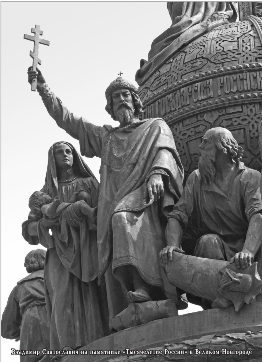
Владимир Святославич на памятнике «Тысячелетие России» в Великом Новгороде

Рассуждая о личности святого князя, святитель Николай Сербский пишет: «Было необходимо показать всем последующим русским поколениям раскаявшегося грешника, поставить у истоков новой России просветившегося язычника, чтобы стоял он, подобно змию медному, и наставлял, укреплял и исцелял оступившихся и маловерных, всех русских христиан во все грядущие времена. Лучшее свидетельство действительности любого лекарства — исцеления больной. Из всех чудес, что творит вера Христова, самое душеполезное — обращение грешника в праведника. И вот как свидетельство такого чуда — личного преобразования — стоит святой Владимир при вратах христианской Руси и снова зовет к каждому русскому: «Я был ночь и превратился